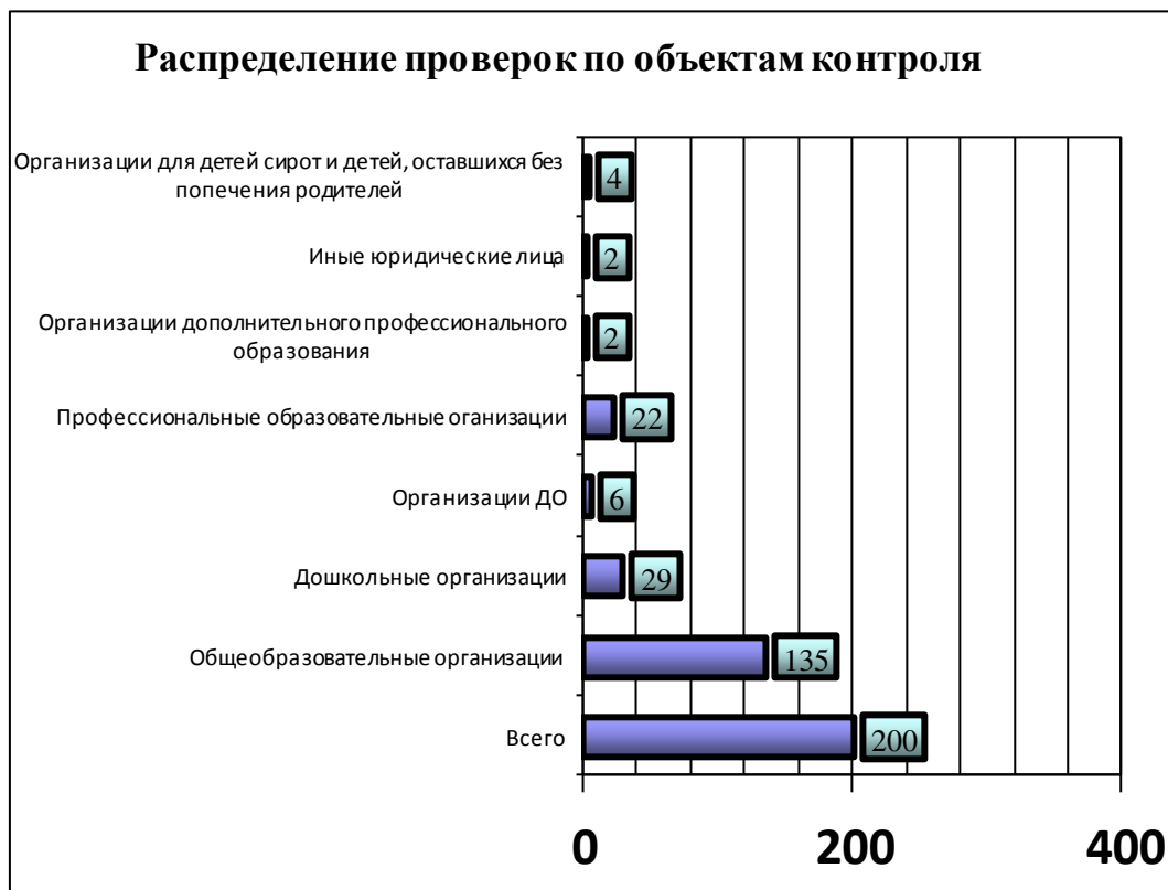
Таблица № 3