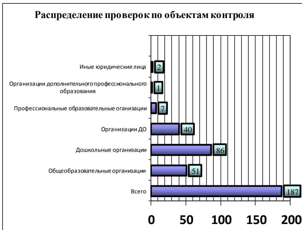
Диаграмма № 3

Общее время проведения проверок в рабочих днях без учета органов местного самоуправления – 1012 (в первом полугодии 2016 года – 489, во втором полугодии 2016 года – 523).